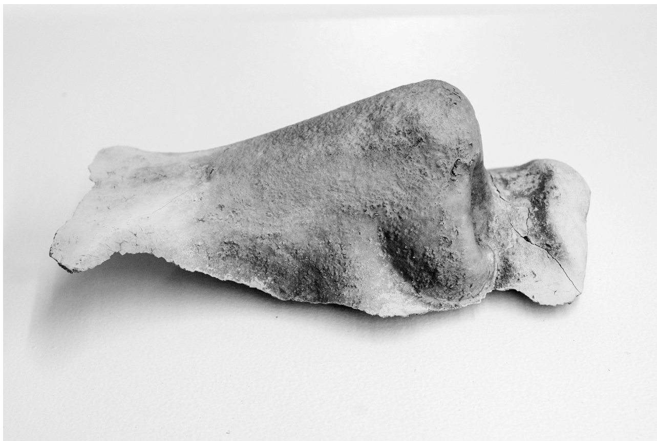
Jan Hostettler, Meta , 2019 Grès, peinture, photographie, texte

Les œuvres exposées nous proposeront un voyage à travers les âges, de l'Antiquité à nos jours, s'appuyant sur le passé ou se projetant vers le futur. Elles seront issues pour certaines de l'observation de notre réalité ou nous plongeront dans le merveilleux. Elles évoqueront toutes, la marche de l'humanité à travers l'espace et le temps, entre rêves et renoncements, libertés et contraintes, beauté et monstruosité ou encore intelligence et absurdité.