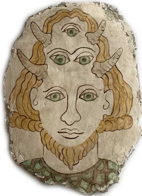
Patric Binda Fresko Fragment , 2018 Papier-mâché, plâtre, peinture à l'huile et vernis, 30x39 cm Crédit: Patric Binda

Avant de découvrir la seconde partie de l'exposition, Sofia Durrieu nous proposera un exercice de gymnastique, de danse ou de musculation. À découvrir en activant cette œuvre aux allures de machine. Puis, nous traverserons la galerie des montres ! L'artiste Patric Binda semble être un spécialiste. Il nous présentera tout d'abord sa collection de pattes de chimères. Puis, il nous présentera « ses ancêtres » par le biais d'images. Pour les plus anciennes, il s'agit de fresques représentant les portraits d'êtres dotés de trois paires d'yeux et de doubles cornes. Paraissant plus récentes, des peintures à l'huile nous