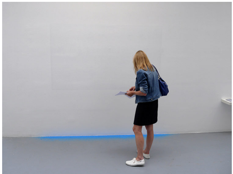
Marianne Mispelaère, Palimpseste (Stratégie d'évasion), 2017