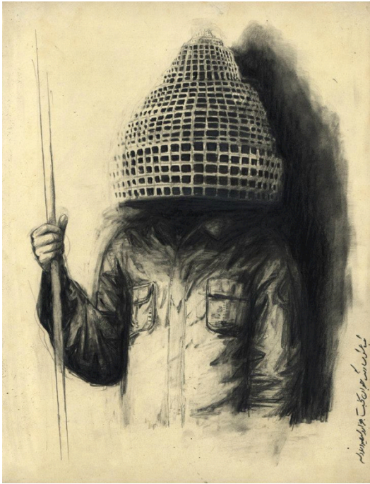
Baktash Sarang, Exercise in Reproduction of Failure III, 2014, 32,5 x 25 cm