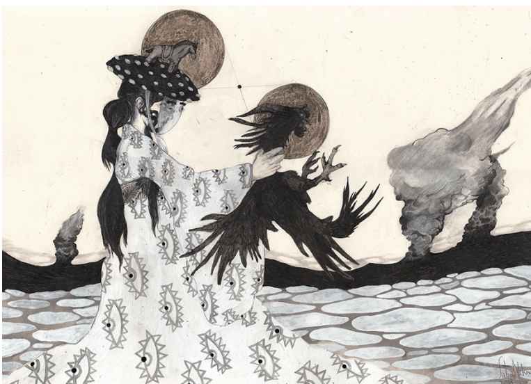
Saba Niknam, Victory, 2018, encre de Chine, feuille d'or, 40 x 50 cm