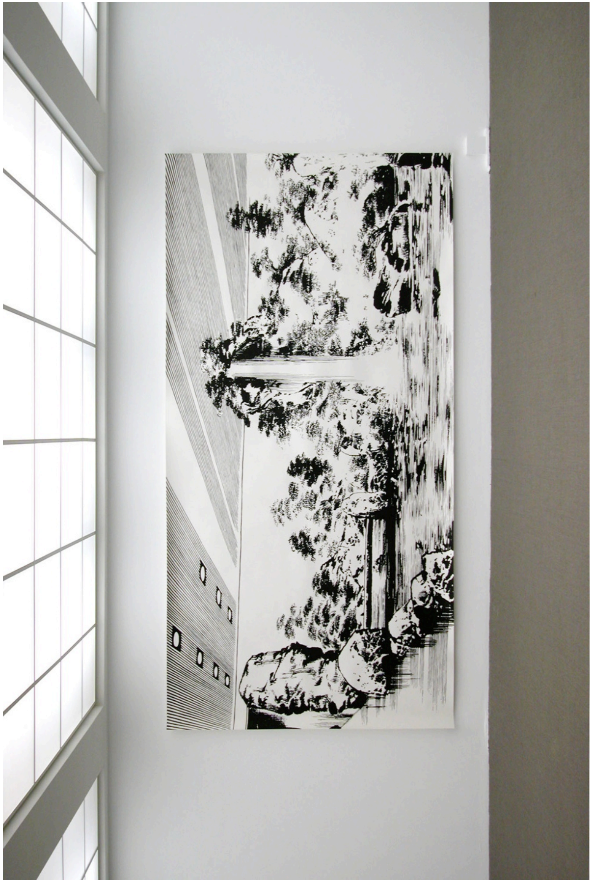
Franziska Furter, Promised, 2005, encre sur papier, 196 x 395 cm