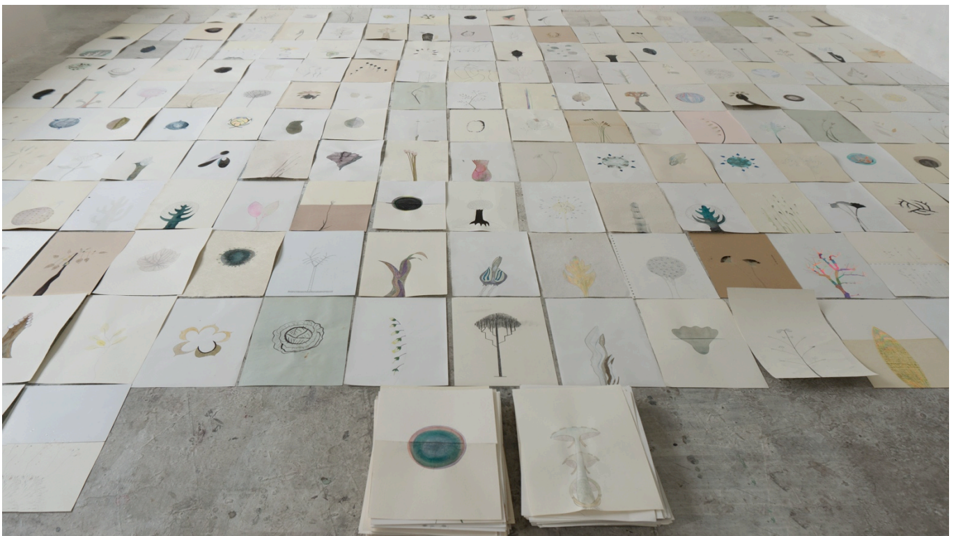
Mireille Gros, Fictionalplants, dessins, techniques et papiers mixtes, 30 x 20 cm chacun, projet toujours en cours.