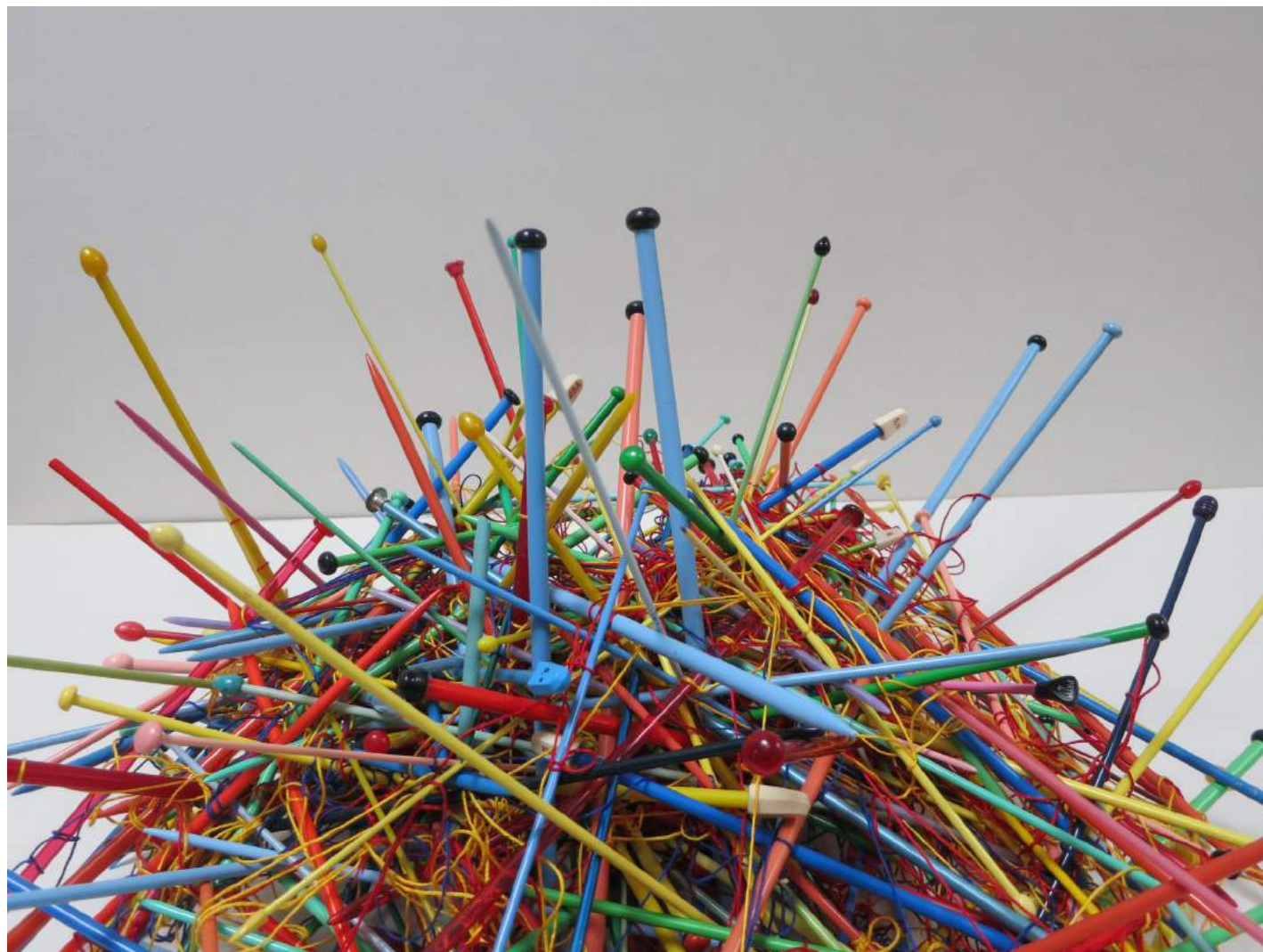
Installation StricknadeIn2 2016