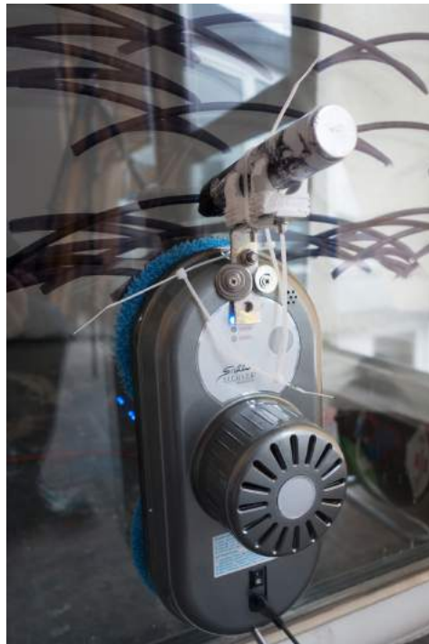
Scheibenroboter V1 & Scheibenzeichnung, 2016