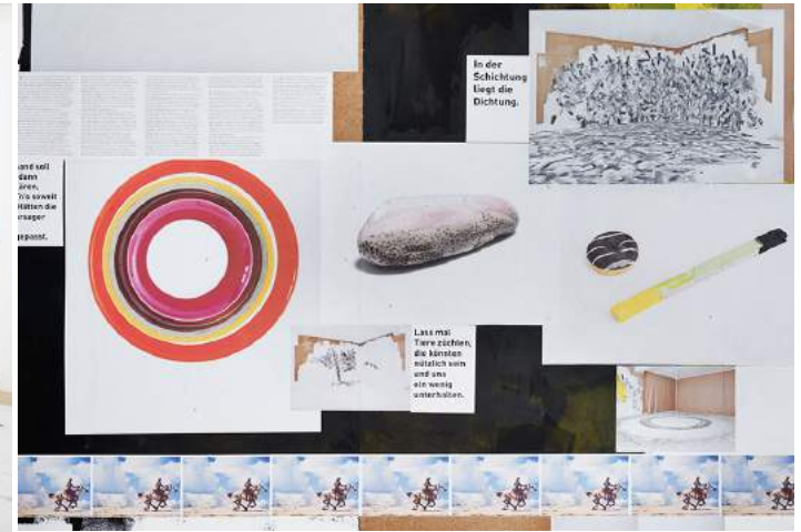
Eine Ausstellung, Kunstraum Aarau janvier - mars 2016