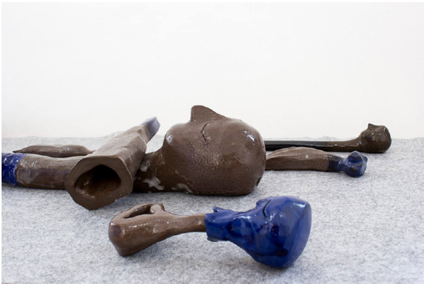
Zsófia Szemző, Delta Sleep/Mended Objects 02 ; argile noire, 2018, Strasbourg, CEAAC

J'ai rencontré beaucoup d'artistes dont le travail était très intéressant. Le CEAAC a aussi une formidable équipe, toujours disponible. Dans tout cela, je suis vraiment très heureuse d'avoir pu bénéficier de cet échange et j'espère pouvoir renouveler l'expérience !