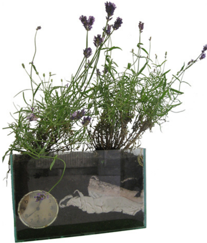
Zsafia Szemző, Burried Memories , 2007, photographie, sol, graines, objets, boîte de verre

Combien de temps cela t'a pris pour épuiser le sujet « gazon » ?