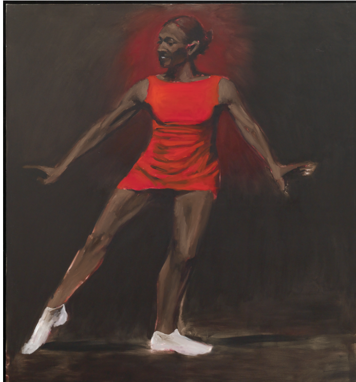
Clamour For A Grip , 2011, Oil on canvas, 200 x 180 cm