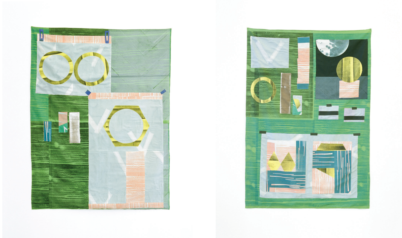
Everything that made it, 2012 acrylic and screenprint on cotton courtesy of the artist and Kendall Koppe, Glasgow Photo : Max Slaven

Qu'elle la pratique seule ou en groupe (en particulier dans le cadre du « Poster Club » qu'elle a créé à Glasgow), la sérigraphie est le médium que Ciara Phillips privilégie. Si elle en revendique la dimension engagée (elle a exposé dernièrement ses œuvres avec celles de Sister Corita Kent), elle insiste plus particulièrement sur la question du « faire » : par la sérigraphie, l'œuvre « indique » qu'elle est manufacturée, un effet de la volonté de l'artiste. Les installations qu'elle réalise, en particulier avec des tentures couvertes de motifs sérigraphiés qui se répètent, intègrent éventuellement des objets et photographies.