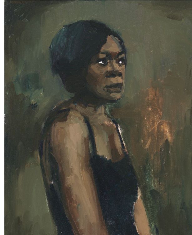
«A Head for Poison», 2011, Oil on canvas, 50 x 40 cm

Les peintures de Lynette Yiadom-Boakye ont systématiquement pour sujet des personnages d'origine africaine, mais il est impossible de déterminer précisément l'époque dans laquelle ils se situent.