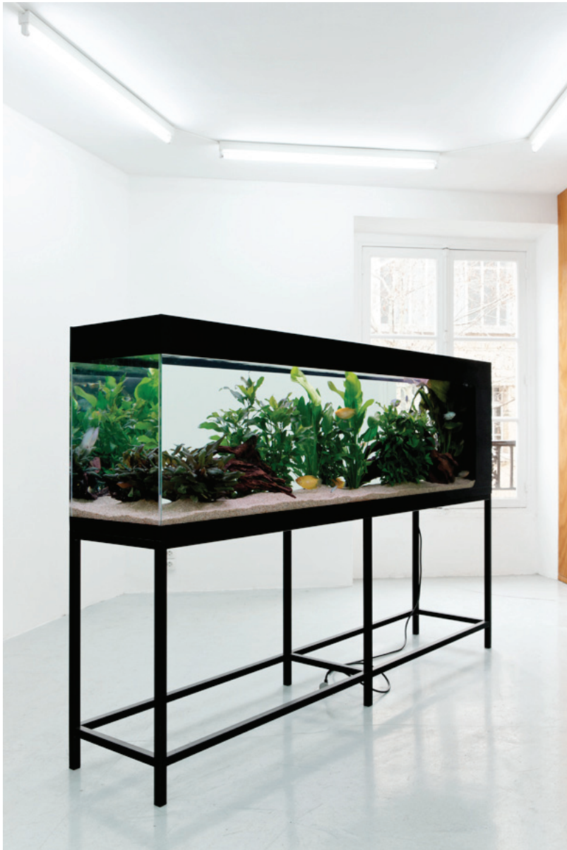
Aquarium , View of Chloé Quenum's personal exhibition, Intervalle Galerie Joseph Tang, Paris. Photo, Aurélien Mole, 2012

Les espaces que créent les œuvres de Chloé Quenum sont purement transitionnels et génériques, mais pourtant autonomes. Réalisées avec des matériaux industriels ou manufacturés peu transformés (bois, encadrements vendus dans le commerce, béton cellulaire...), modifiées par des gestes simples (des coups d'éponge imbibées de javel ou de javel et d'encre), ou alors complètement ready-made (ainsi des aquariums sur socle), ses œuvres semblent réalisées pour meubler un espace d'attente, alors qu'elles le constituent.