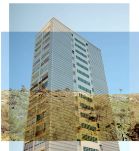
Denis Prisset Immeuble et paysage , 2011

Enfin, nous apaiserons notre regard en contemplant les portraits de Lynette Yiadom-Boakye qui modestement comble une lacune de l'histoire de l'art qui a trop longtemps négligé la représentation des hommes et des femmes d'origine africaine. Chargées d'humanité, ces peintures nous rappelleront que toute image ne reste qu'un double partiel d'une réalité complexe.