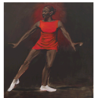
Lynette Yiadom-Boakye, Clamour For A Grip , 2011

Dans ce cadre, deux médiateurs sont à la disposition des enseignants et de leurs classes afin de découvrir et de mieux appréhender les nouveaux moyens d'expression qui constituent l'art actuel.