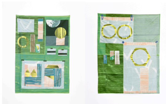
Ciara Phillips, Everything that made it , 2012